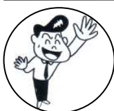
あのひと ano hito that person over there